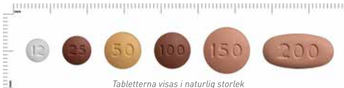
Tabletterna visas i naturlig storlek