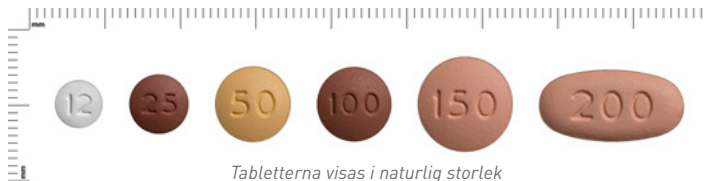
Tabletterna visas i naturlig storlek