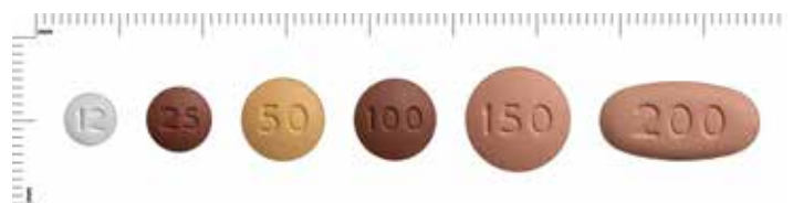
Tabletterna visas i sin naturliga storlek